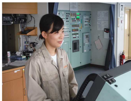
船橋において：甲板手として航海当直中の見張りや操舵に従事して本船の安全運航に努めています。航海当直中は常に緊張の連続ですが、やりがいのある仕事です。

出産・育児期間を含めたワークライフバランスで、実情に即した仕組みを構築し、女性にも働きやすい職場を目指しています。