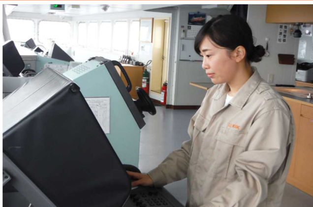
船橋において：RADARやECDIS、双眼鏡等の機器を使用して航海当直に従事。北海道航路に乗船しているため、三陸地方沿岸の濃霧の時期はボンデンなどの漁具や漁船の動向に気を使います。